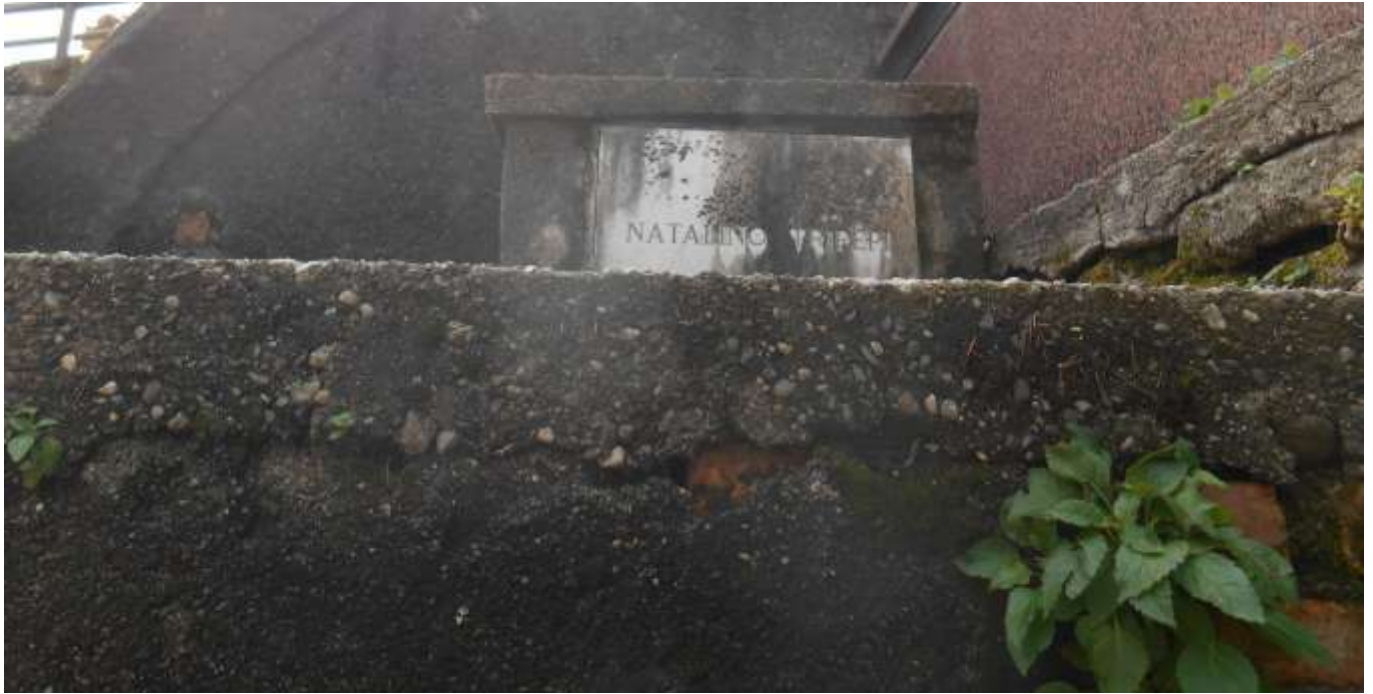
FOTOGRAFIA N. 54

Ordinanza del Sindaco n. 05/2026 - Prot. N.1066/2026 del 06/02/2026