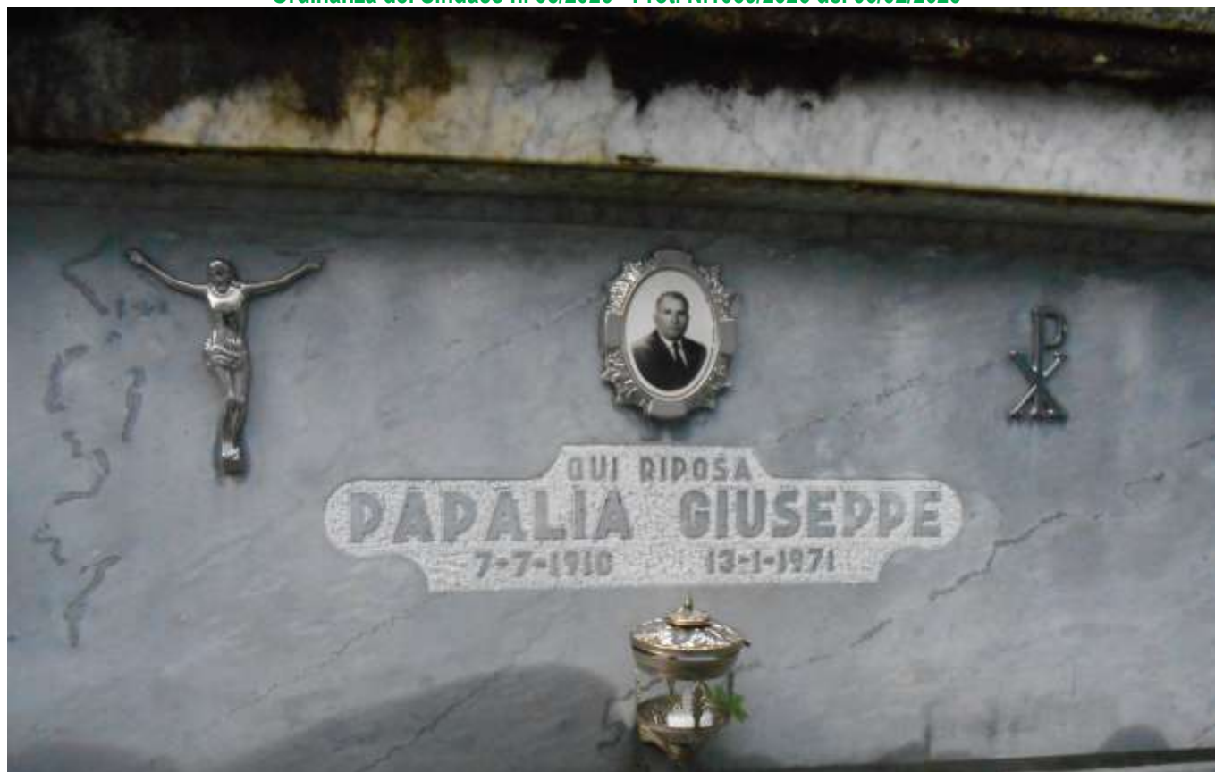
FOTOGRAFIA N. 12