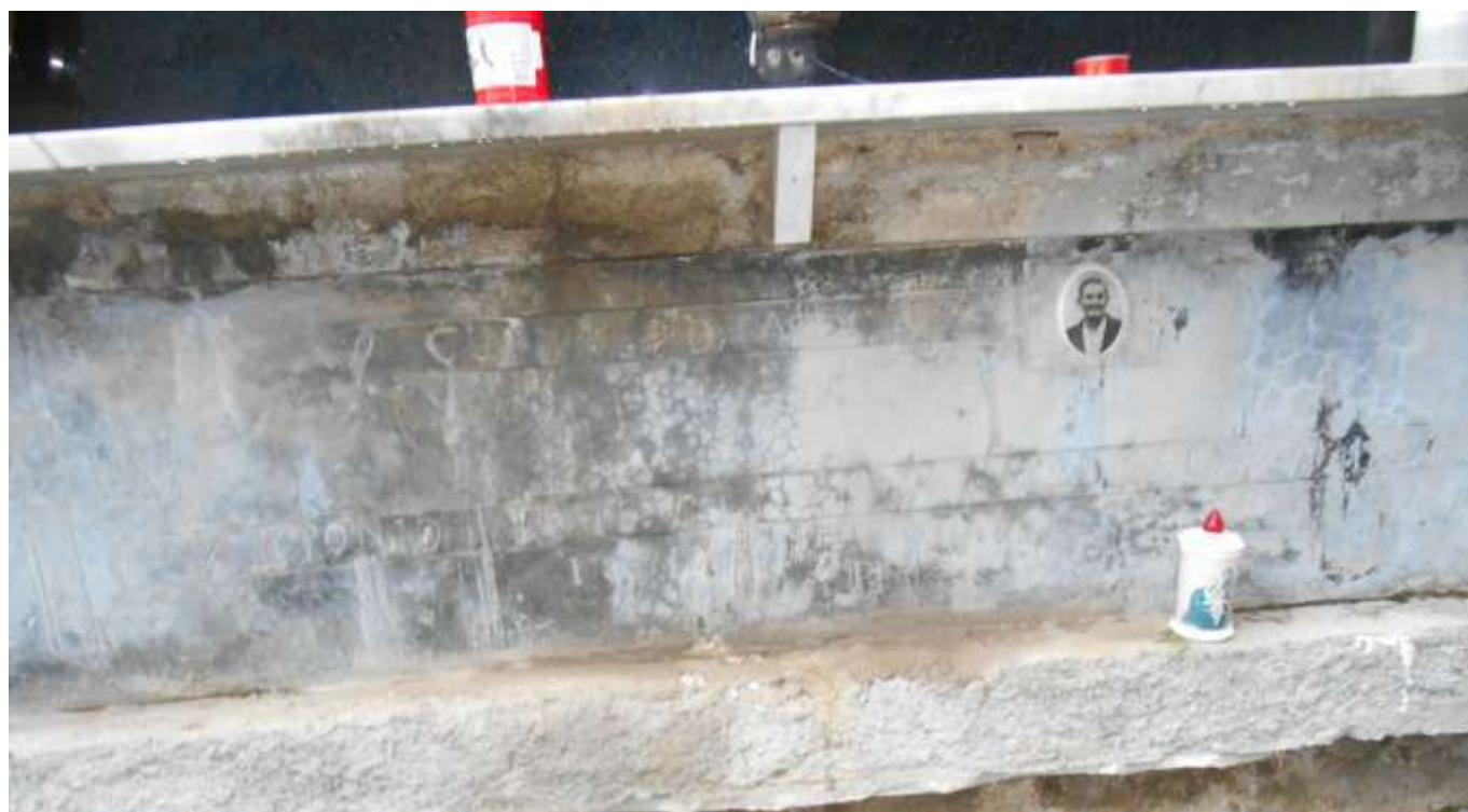
FOTOGRAFIA N. 25