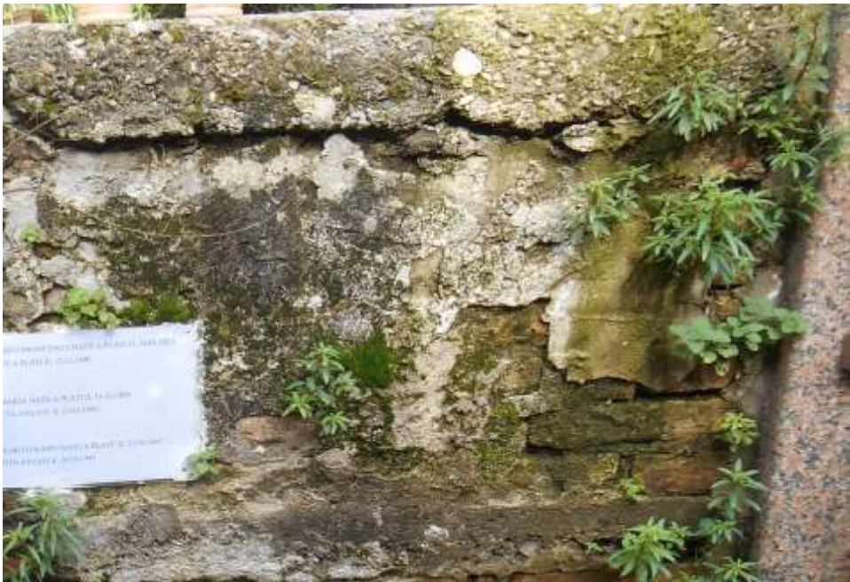
FOTOGRAFIA N. 48