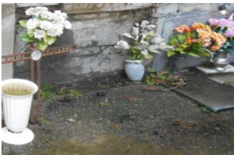
FOTOGRAFIA N. 33