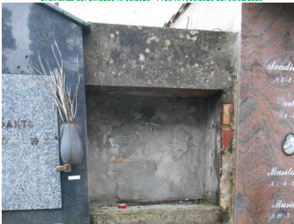
FOTOGRAFIA N. 22

Ordinanza del Sindaco n. 05/2026 - Prot. N.1066/2026 del 06/02/2026