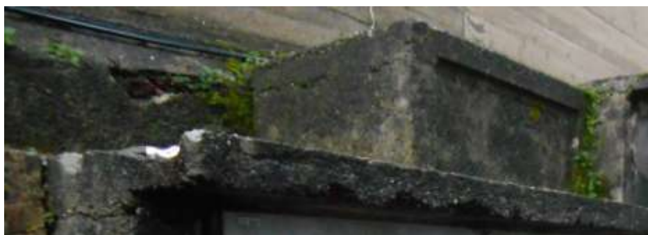
FOTOGRAFIA N. 16