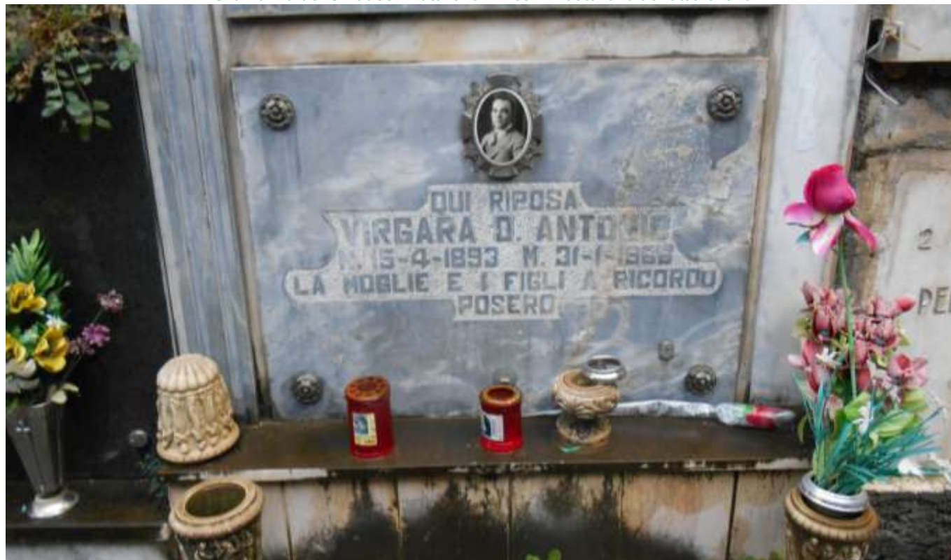
FOTOGRAFIA N. 29