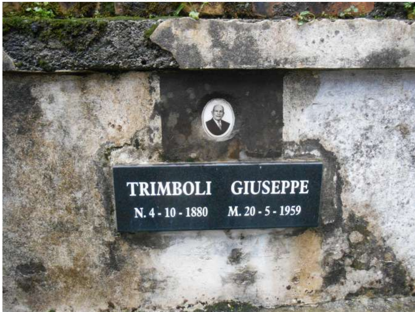
FOTOGRAFIA N. 04