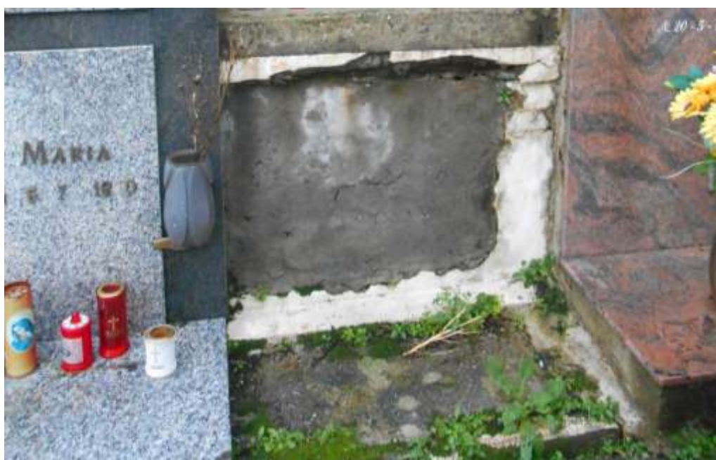
FOTOGRAFIA N. 23