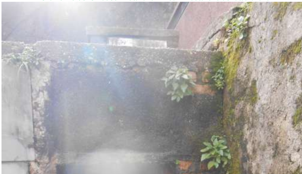
FOTOGRAFIA N. 52

Ordinanza del Sindaco n. 05/2026 - Prot. N.1066/2026 del 06/02/2026