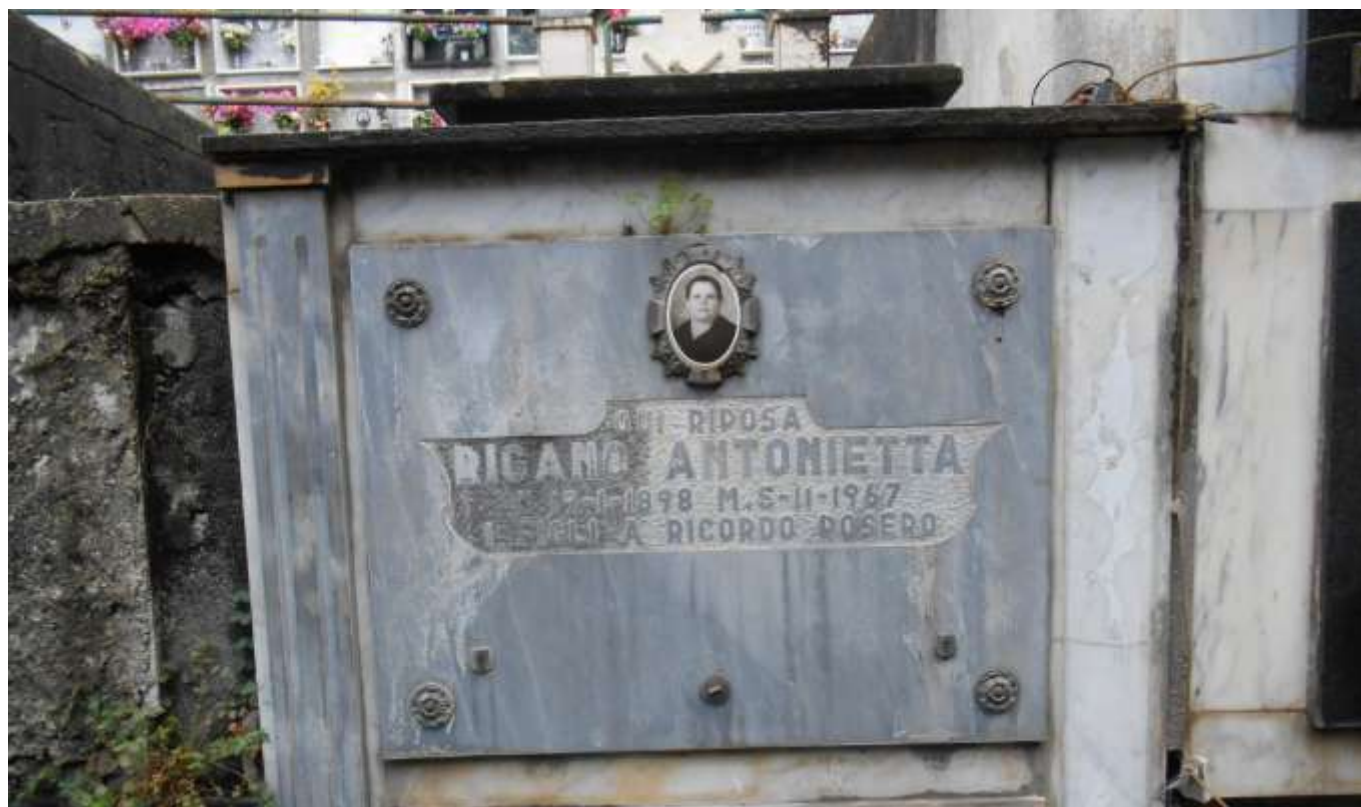
FOTOGRAFIA N. 28