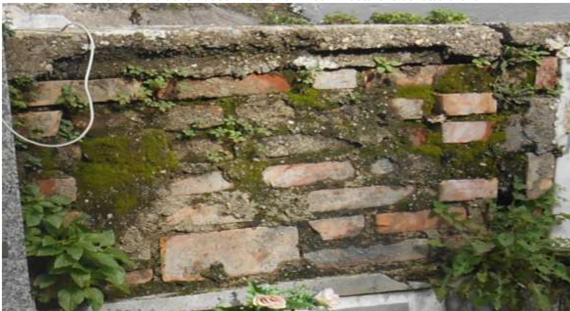
FOTOGRAFIA N. 39

Ordinanza del Sindaco n. 05/2026 - Prot. N.1066/2026 del 06/02/2026