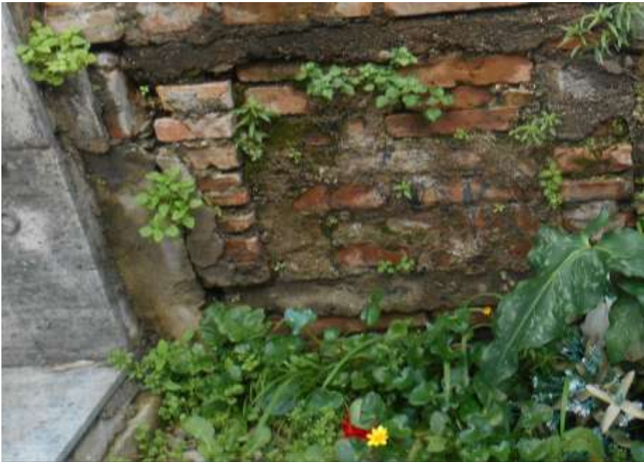
FOTOGRAFIA N. 47

Ordinanza del Sindaco n. 05/2026 - Prot. N.1066/2026 del 06/02/2026