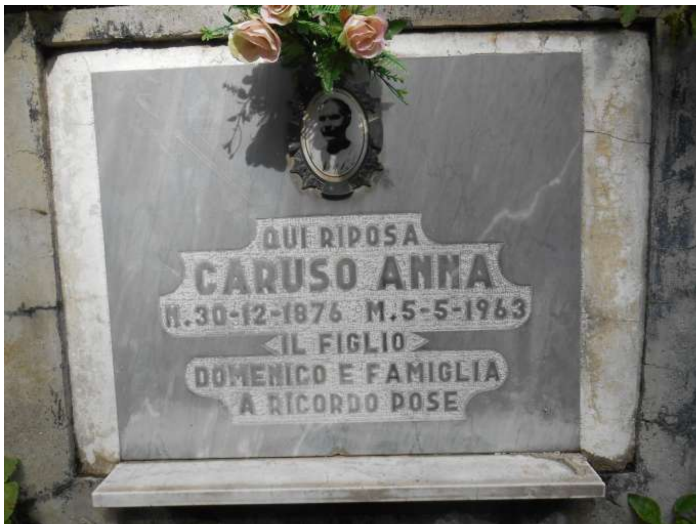
FOTOGRAFIA N. 40