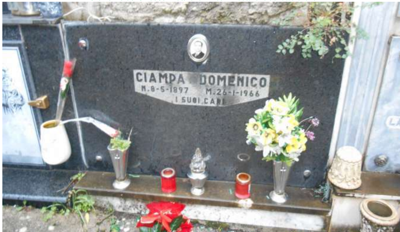
FOTOGRAFIA N. 26

Ordinanza del Sindaco n. 05/2026 - Prot. N.1066/2026 del 06/02/2026