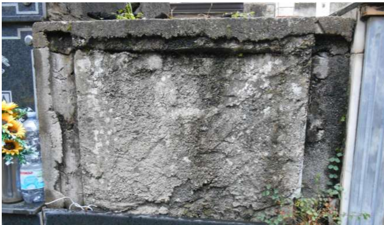
FOTOGRAFIA N. 27