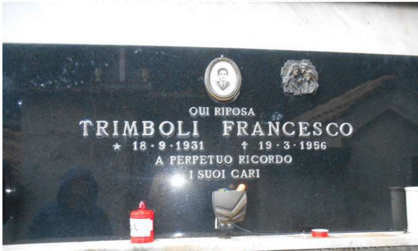
FOTOGRAFIA N. 24