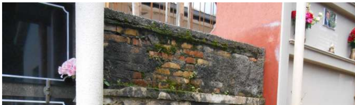
FOTOGRAFIA N. 05