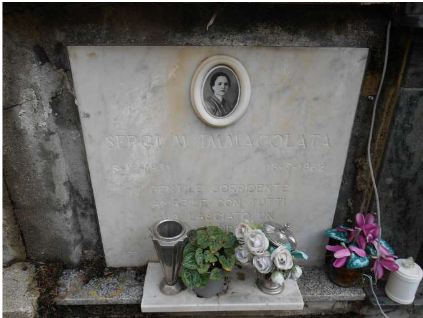
FOTOGRAFIA N. 32