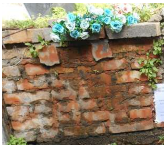
FOTOGRAFIA N. 46