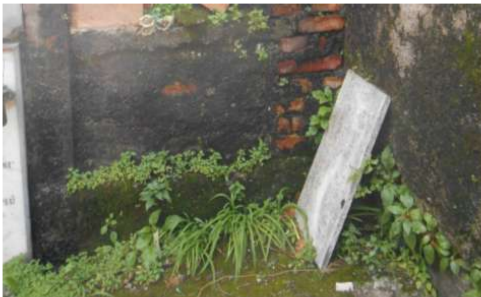
FOTOGRAFIA N. 53